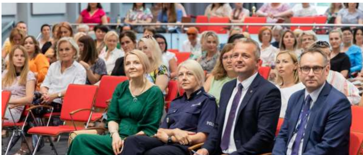
Konferencja w Bydgoszczy

Na terenie Miasta działa Zespół Interdyscyplinarny w Chełmży, powoływany przez Burmistrza Miasta Chełmży. Podstawowym celem działania Zespołu Interdyscyplinarnego jest koordynacja działań w celu skutecznego rozwiązywania problemów określonych rodzin. Koordynacja ta łączy w sobie konieczność przepływu informacji między instytucjami mogącymi zapewnić pomoc, wypracowanie modelu pomocy dostosowanej do problemów danej rodziny oraz najbardziej efektywne, realne udzielanie pomocy.