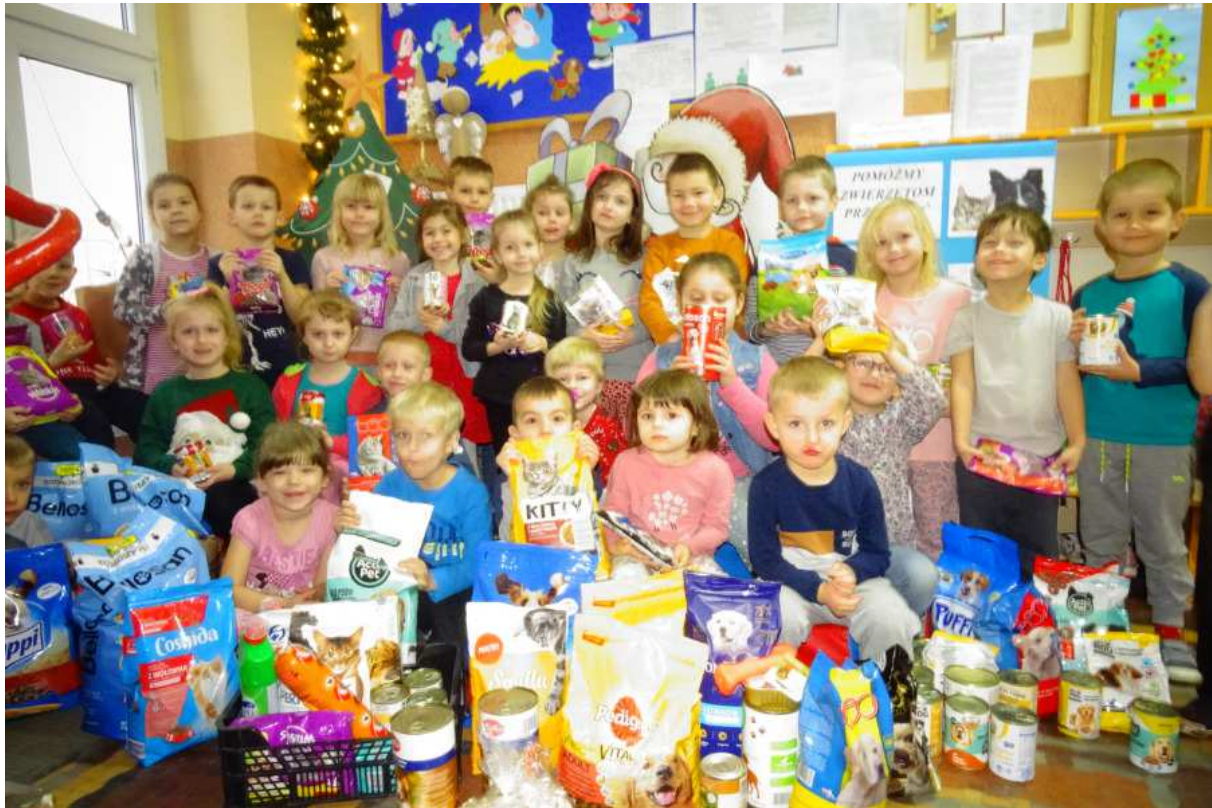
Dzieci z Przedszkola Miejskiego nr 1