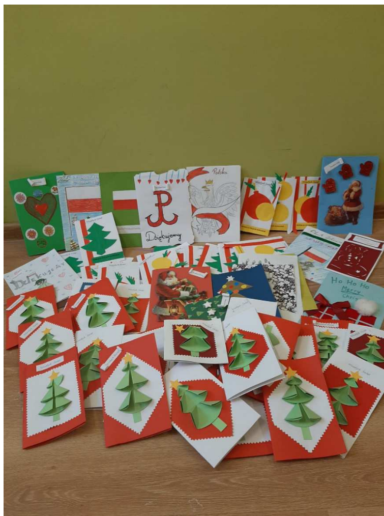
Prace wykonane przez uczniów SP-3