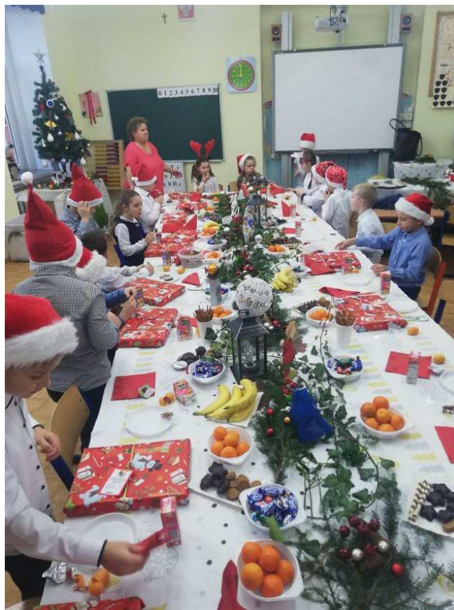
Wigilia klasowa w SP-2