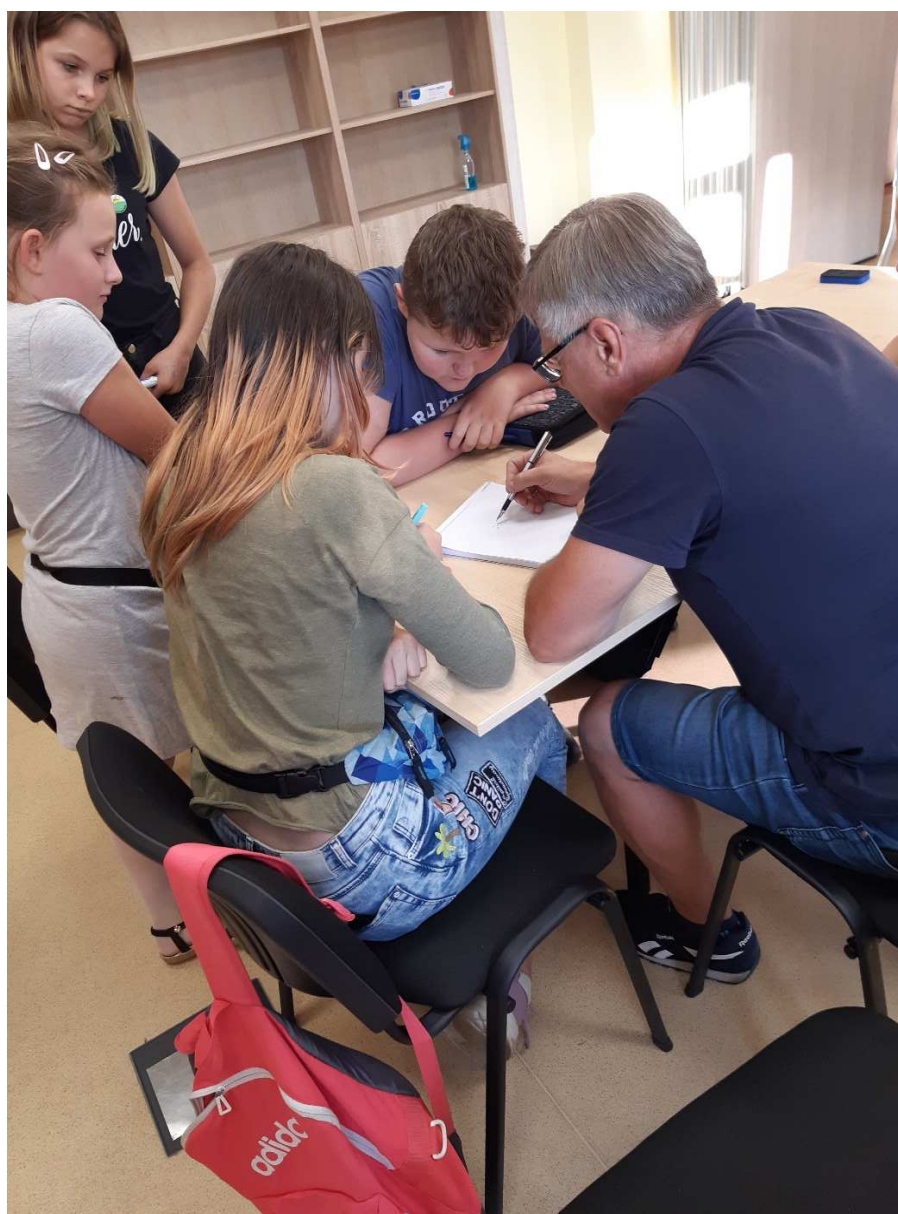
Zajęcia z matematyki