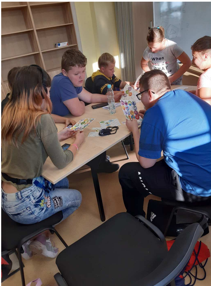
Gry i zabawy

Dużą radość uczestnikom projektu sprawiają gry i zabawy integracyjne. Dostarczają one miłych wrażeń, pobudzają spostrzegawczość, umiejętność porozumiewania się ze sobą, uczą logicznego myślenia. W trakcie realizacji projektu planowane są trzy wycieczki edukacyjne.